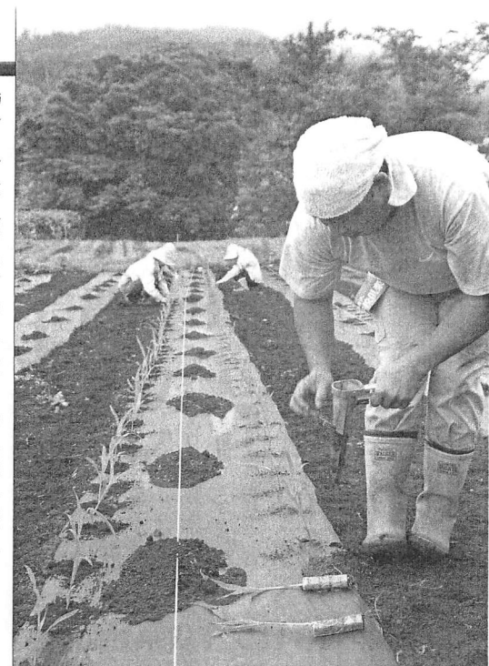
NPO法人「さっぽろ農学校倶楽部」の農場では、学校給食に提供するスイートコーンの苗を定植。慣れた手つきで作業が進む(7月20日、南区北ノ沢で)