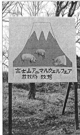
「アマルウエルフェア動物福祉」を前面に掲げる牧場の看板

火山灰や噴石が降り積もった富士山麓に入植した戦後開拓者たちは、雑穀や野菜づくりを試みるが、きびしい自然条件のなかで挫折し、数年後には酪農を導入していく。国の事業などを活用して基盤整備を進め、広大な草地を