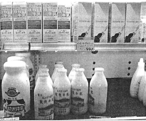
「放牧牛乳」は日量1トン製造し、県内外に販売している