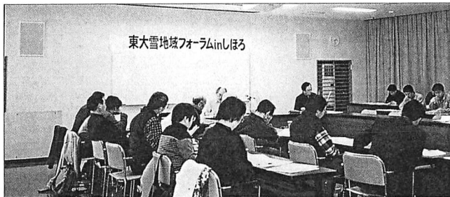
住民有志が開いた東大雪地域フォーラム。出されたアイデアをまとめ行政側に提言した（今年2月、士幌町内で）

振興策に限界を感じ、マイペースで活動することにした。最近、士幌町内に「環境教育・アウトドア活動サポートセンター」を設立し、民間財団の助成を受けて簡易水質検査器や視聴覚機材などを購入する一方で、学校と協力してリーダー養成やパネル展の開催などを始めている。自治体が進める振興策