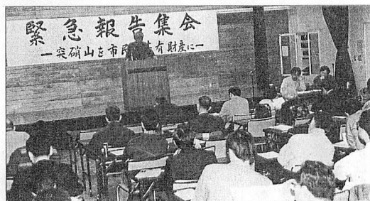
公有地化のあり方や保全策を論議した「考える会」の集会（2月27日）