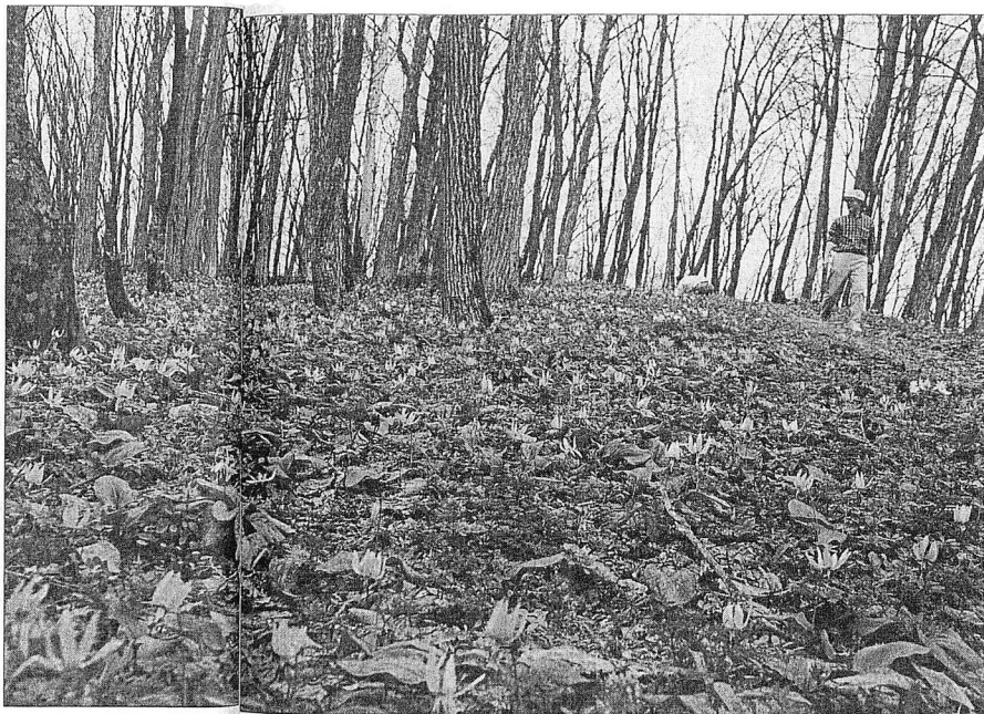
国内有数のカタクリの群落が広がる早春の突哨山（4月27日、南端部の男山自然公園で）

年に入り、ゴルフ場用地が競売にかけられて、突哨山の保全活動は新たな局面を迎えている。